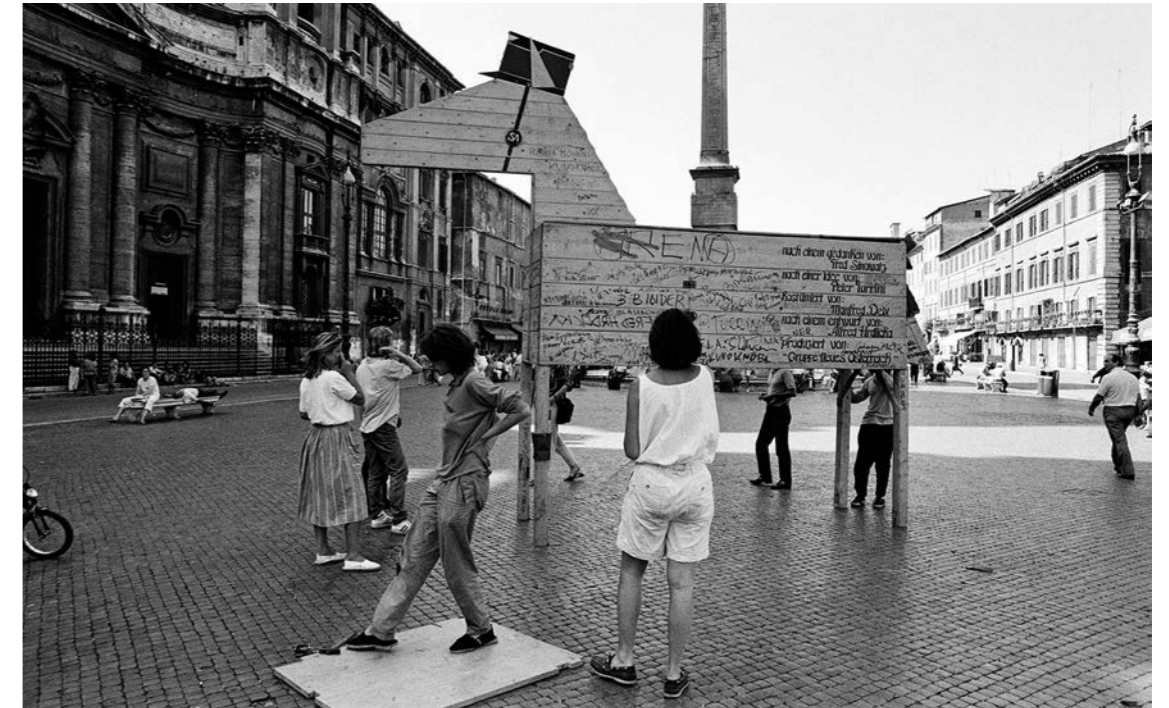
Das Holzpferdes von Alfred Hrdlicka (nach einer Idee von Kuno Knöbl)

Dreißig Jahre später stellten sich viele Fragen: Wie kam es, dass der Wahlkampf Kurt Waldheims zu einem internationalen Skandal wurde? Wie wirkt dieser historische Moment weiter, als die Lüge von „Österreich als erstem Opfer“ in sich zusammenfiel, was einerseits zu befreiender Klarheit führte, andererseits der Instrumentalisierung der NS-Vergangenheit eine neue Wende gab. Wieso wurde ein Nixon zum Rücktritt gezwungen, während in Österreich so gut wie nie jemand abtritt? Warum regte den Jüdischen Weltkongress just die Person Waldheim so auf? Und wie manifestiert sich der typisch österreichi-